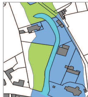
Illustration 4 : extrait du plan de zonage

Les parcelles 435 et 436 sont situées en zone bleue. Le règlement du PPR laisse la possibilité au pétitionnaire de faire une extension ou de construire avec les prescriptions associées. Toutefois, c'est le règlement le plus défavorable entre le PLU et le PPR qui s'imposera au pétitionnaire. »