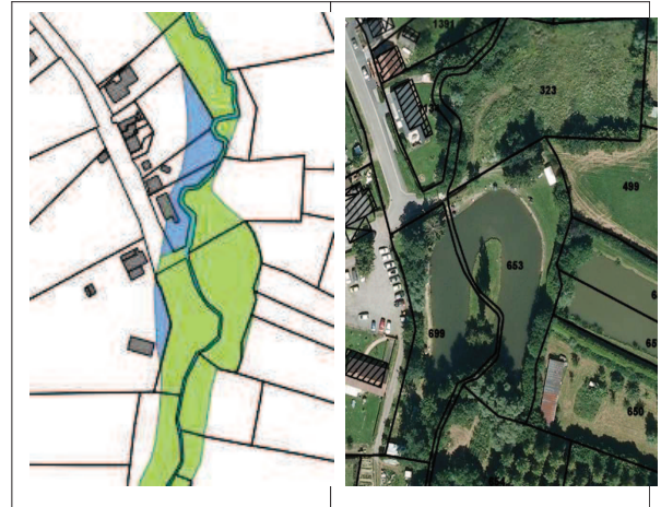
Illustration 2 : extrait du plan de zonage et vue aérienne sur la zone concernée.

Ces éléments, notamment la topographie du terrain, confirment donc le zonage sur la parcelle 323. Pour votre information, la parcelle 323 en zone UC au POS reste constructible en dehors de la zone verte identifiée sur la carte de zonage . »