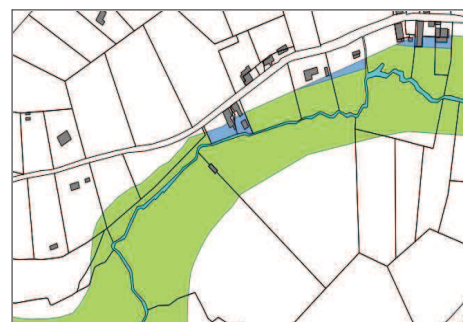
Illustration 1 : Extrait de la carte de zonage de Gommegnies (au centre la parcelle concernée)

Ainsi, après avoir pris en considération la requête exprimée, le zonage, situé sur la parcelle concernée, est justifié. »