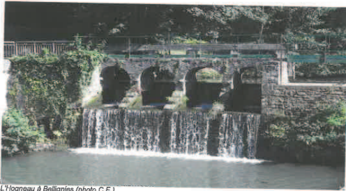
L'Hogneau à Bellignies